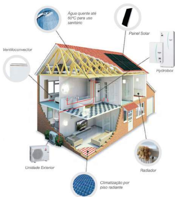
Diagrama de funcionamento: AQS + Ventiloconvectores/Radiadores