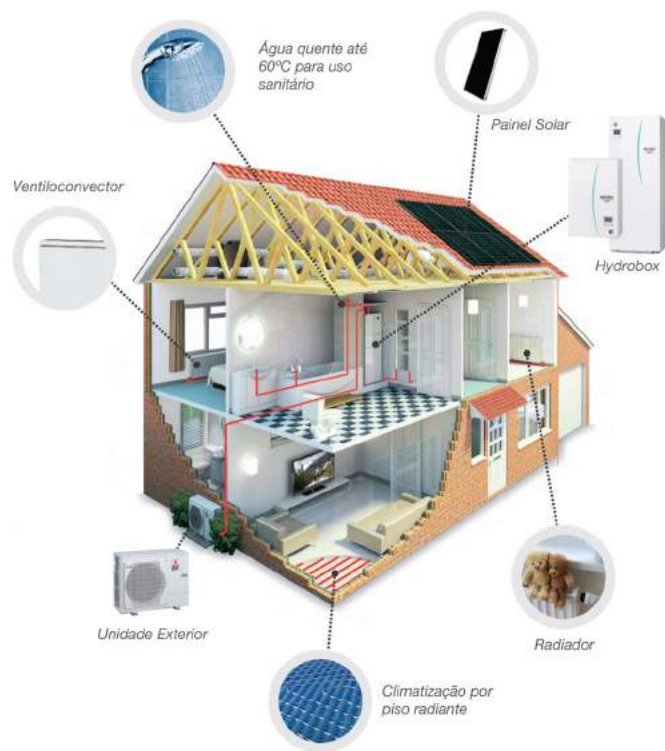
Diagrama de funcionamento: AQS + Ventiloconvectores/Radiadores